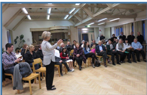
1848-as és Petőfi Emlékest