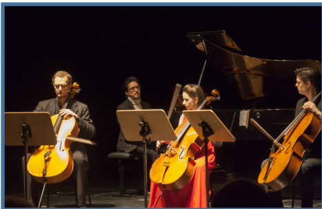
Beszámoló a jótékonysági koncertről