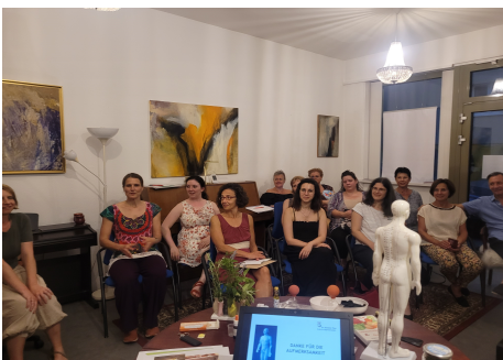
KÁVÉZACC – az új program