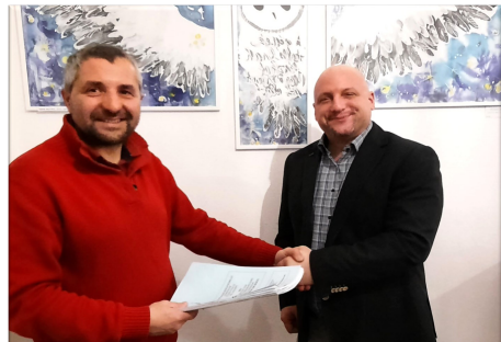
A MEÖK régi és új elnöke