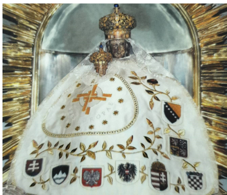
40. zárándoklat Mariazell