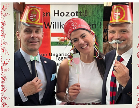
Magyar bál Grácban