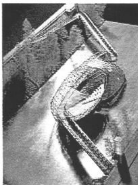
Sziget a Murán