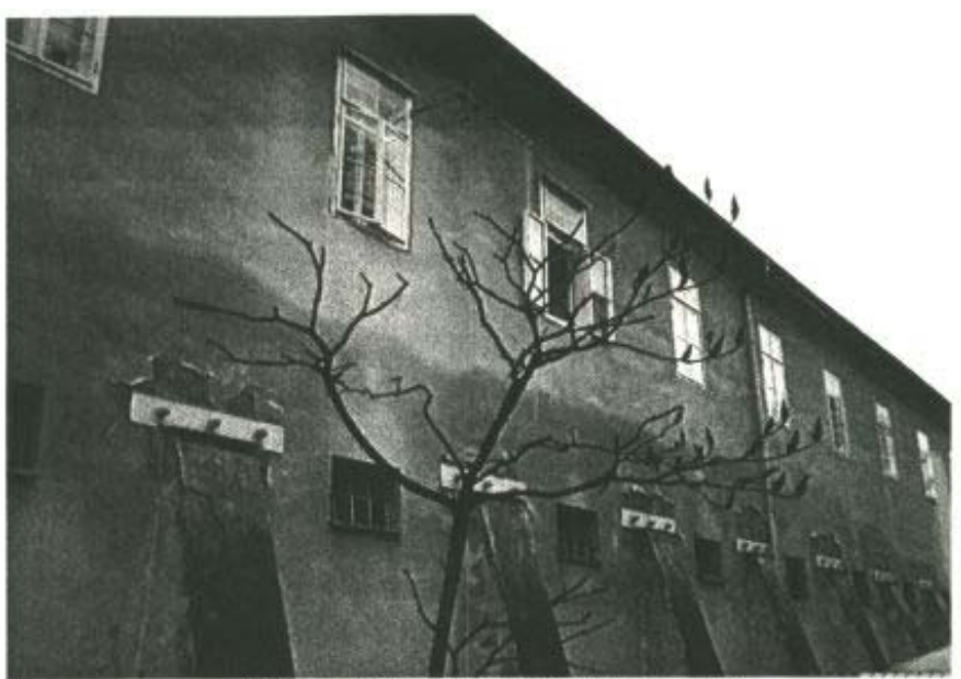
A lovassági kasszárnya (Reiterkaserne)